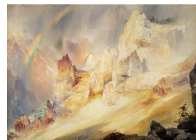
“Arc-en-ciel sur le Grand Canyon de Yellowstone” - Thomas Moran

Na ile czuвам nad swoim sercem, nad myślami, które je zamieszkują? Ożywię w sobie pamięć o Bogu.